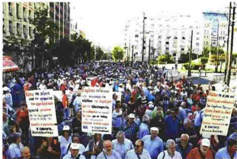
Από προηγούμενο πανελλαδικό συλλαλητήριο των συνταξιούχων στην Αθήνα

« Δεν διαπραγματευόμαστε ψίχουλα. Ζητάμε πίσω τώρα ό,τι μας έχει αφαιρεθεί, είναι δουλεμένα και πληρωμένα όλα από εμάς, δεν τα χρωστάμε σε κανένα και τα διεκδικούμε στο ακέραιο », αναφέρουν οι συνταξιοχικές οργανώσεις στην ανακοίνωσή τους. Διαμηνύουν πως δεν υποχωρούν αλλά δυναμώνουν και κλιμακώνουν τους αγώνες τους. « Δεν νομιμοποιούμε στη συνείδησή μας ό,τι μας έχει αφαιρεθεί, δεν θα κάνουμε πι-