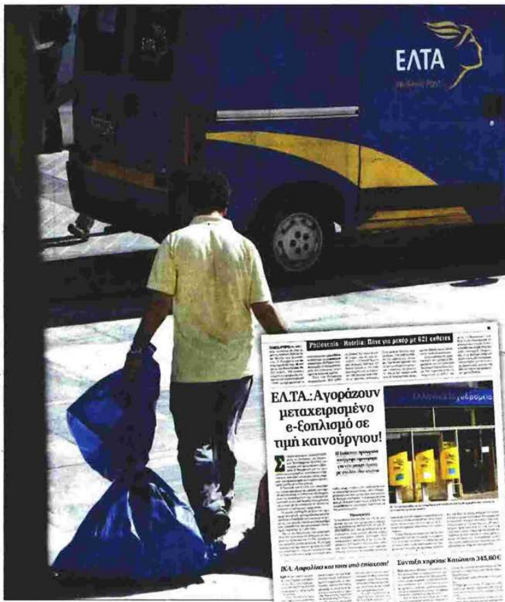
Υπάλληλος των ΕΛ.ΤΑ. μεταφέρει δέματα. Δεξιά, το δημοσίευμα της «δημοκρατίας» στις 16/11/2016

Ειδικότερα, η σημερινή διοίκηση των Ελληνικών Ταχυδρομείων δεν απέρριψε προσφορά της Τράπεζας Eurobank, διότι ποτέ δεν έλαβε τέτοια προσφορά. Η σημερινή διοίκηση αναζήτησε τη