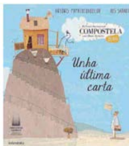
Το «Ένα τελευταίο γράμμα» θα εκδοθεί στα ελληνικά το 2017.

Βραβείο Εικονογραφημένου Βιβλίου Compostela 2016 για τον Αντώνη Παπαθεοδούλου και την Ιριδα Σαμαρτζή.