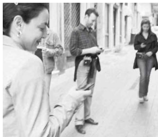
Ο τζίρος των τηλεπικοινωνιακών εταιρειών πέρυσι διαμορφώθηκε στα 5,01 δισ. ευρώ.

Η συγκεκριμένη αγορά υποχώρησε πέρυσι στα 2,2 δισ. ευρώ,