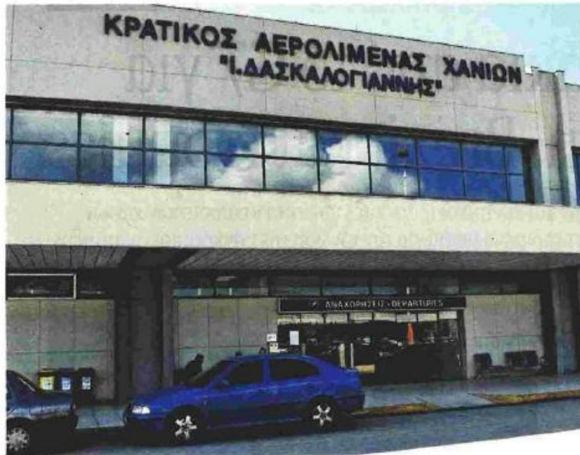
Αν και είχε προβλεφθεί το 20% των εσόδων από την πώληση του αεροδρομίου Χανίων να αποδίδεται στον δήμο, με απόφαση του Πρωθυπουργού και ύστερα από παρέμβαση των θεσμών, η ρύθμιση αποσύρθηκε

Την ίδια στιγμή, η κυβέρνηση επιχειρεί να πείσει με μισές αλήθειες ότι το υπερταμείο στο οποίο μπαίνει ως εγγύηση για το χρέος ένας τερστίσιος