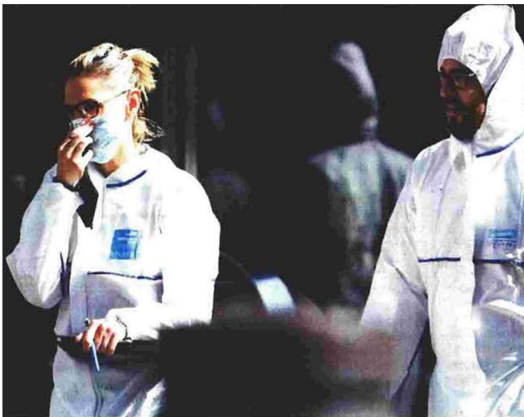
Σε συναγερμό οι γαλλικές Αρχές μετά την επίθεση στα γραφεία του ΔΝΤ και της Παγκόσμιας Τράπεζας στο Παρίσι