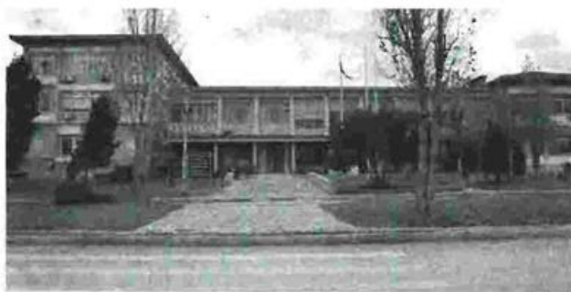
Το Ταχυδρομείο ξεκίνησε να λειτουργεί στο Πανεπιστήμιο προ 26 ετών έπειτα από αίτημα της τότε πρυτανικής αρχής

Α νεστάλη από την περασμέ- νη Δευτέρα η λειτουργία του Ταχυδρομείου στο Πανε- πιστήμιο Πατρών, με τα ΕΛ- ΤΑ να κάνουν λόγο, για έξω- σή τους από τις πρυτανικές αρχές, από τον παραχωρη- μένο χώρο του Ιδρύματος. Σύμφωνα με την ανακοίνω- ση των ΕΛΤΑ, το Ταχυδρο- μείο δημιουργήθηκε προ 26 ετών έπειτα από αίτημα της τότε Πρυτανικής Αρχής, σε χώρο που είχε παραχωρη- θεί, καλύπτοντας ανάγκες τα- χυδρομικής εξυπηρέτησης, πληρωμές λογαριασμών φο- ρέων κοινής ωφέλειας, εξο- φλήσεις οφειλών προς το Δημόσιο, κ.ά. Παράλληλα, αναφέρεται ότι το Ταχυδρομείο του Πανε- πιστημίου Πατρών αυτο- ματοποιήθηκε προ μηνός