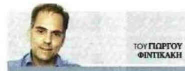
ΤΟΥ ΓΙΩΡΓΟΥ ΦΩΤΑΚΑΚΗ

Το μεγάλο ερωτηματικό του τρίτου κόκκινου Μνημονίου συνιστά το νέο υπερταμείο για την αξιοποίηση της δημόσιας περιουσίας και απαντήσεις θα πάρει μόνο από τα πρόσωπα που θα αναλάβουν να το στελεχώσουν.