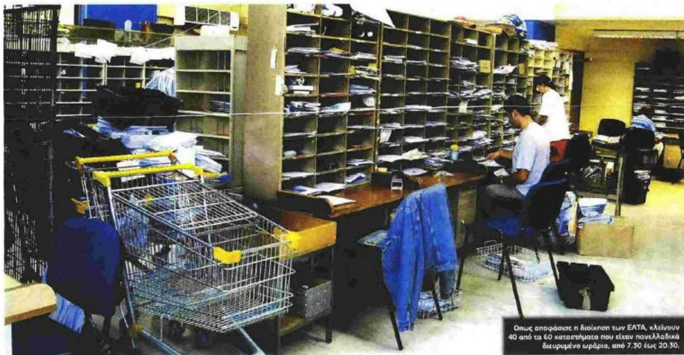
Όπως αποφάσισε η διοίκηση των ΕΛΤΑ, «κλείνουν 40 από τα 60 καταστήματα που είχαν πανελλαδικά διευρυμένο ωράριο, από 7.30 έως 20.30.

ΕΛΤΑ: ΑΝΑΣΤΟΛΗ ΤΗΣ ΛΕΙΤΟΥΡΓΙΑΣ ΔΕΚΑΔΩΝ ΚΑΤΑΣΤΗΜΑΤΩΝ ΤΙΣ ΑΠΟΓΕΥΜΑΤΙΝΕΣ ΩΡΕΣ ΑΠΟΦΑΣΙΣΕ Η ΔΙΟΙΚΗΣΗ