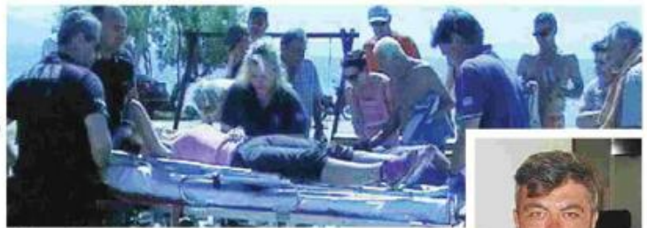
Η 42χρονη διανομέας τραυματίστηκε από την πτώση και μεταφέρθηκε στο Νοσοκομείο

Άμεσα ο συνάδελφός της έσπευσε στο σημείο. Κλήθηκε τροχαία και ασθενοφόρο, που μετέφερε τη 42χρονη στο Νοσοκομείο, όπου νοσηλεύεται με σπασμένα πλευρά, κτύπημα στη μέση και ράμματα στο κεφάλι. Η διανομή... όπως ήταν φυσικό έμεινε στη μέση. Ο συνάδελφός της 42χρονης, φρόνησε να πάρει την αλληλογραφία και τα χρήματα και να τα επιστρέψει στα κεντρικά ΕΛ.ΤΑ. ενώ