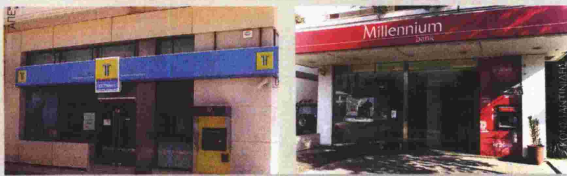
Μαγνιτίζουν το ενδιαφέρον των τραπεζών το Νέο Ταχυδρομικό Ταμιευτήριο και η Millennium.

►► ΟΙ ΤΡΑΠΕΖΕΣ ΙΣΧΥΡΟΠΟΙΟΥΝΤΑΙ ΑΠΟ ΤΑ DEALS ΚΑΙ ΑΝΑΖΗΤΟΥΝ ΝΕΟΥΣ ΣΤΟΧΟΥΣ