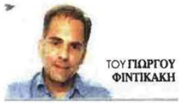
ΤΟΥ ΓΙΩΡΓΟΥ ΦΙΝΤΙΚΑΚΗ

Η συμφωνία με τους δανειστές για το Υπερταμείο φέρνει ανατροπές και θα επιχειρήσει να κόψει τον ομφάλιο λώρο που παραδοσιακά συνδέει τις μικρές ή μεγάλες κρατικές επιχειρήσεις με το πολιτικό σύστημα