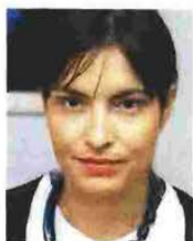
Ο πρόεδρος του Εποπτικού Συμβουλίου Ζακ λε Παπ και η διευθύνουσα σύμβουλος του Υπερταμείου Ουρανία Αικατερινάρη

Η ΑΛΗΘΕΙΑ είναι ότι όλα τα παραπάνω μοιάζουν πολύ ωραία για να είναι αληθινά. Και αυτό καθώς είναι πάρα πολλοί που αμφισβητούν όχι την πρόθεση της κυβέρνησης να τηρήσει και τυπικά την υποχρέωσή της, δηλαδή να συστήσει τον νέο οργανισμό, όσο το να αφήσει πραγματικά τη διοίκισή του να εφαρμόσει τη συμφωνία.