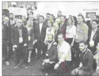
Ο Ν. Παιπάς συμμετέχει στο Mobile World Congress 2017 (MWC17), στο μεγαλύτερο event ψηφιακής επικοινωνίας παγκοσμίως, που πραγματοποιείται στην Βαρκελώνη της Ισπανίας

ΕΚΑΘΑΡΟ μήνυμα ότι «η Ελλάδα –αφού πέ- ρασε από τη φάση με τις γνωστές οικονομικές και άλλες δυσκολίες- πλέον έχει παρά πολύ μεγάλες δυνατότητες να σχεδιάσει για το μέλλον» έστειλε ο υπουργός Ψηφιακής Πολιτικής Νίκος Παιπάς. Ο κ. Παιπάς συμμετέχει στο Mobile World Congress 2017 (MWC17), στο μεγαλύτερο event ψηφιακής επι- κοινωνίας παγκοσμίως, που πραγματοποιείται στην Βαρκελώνη της Ισπανίας. Ο ίδιος επισκέφθηκε το ελληνικό περίπτερο και, με την ευκαιρία, δήλωσε τα εξής: «Φέτος, η ελληνική παρουσία στο MWC17 είναι ακόμα πιο ισχυρή, με 25 ελληνικές εταιρείες που συμμετέχουν μέσω του περιπτέρου της χώρας μας. Αυτή ακριβώς η συμμετοχή σηματοδοτεί ότι η Ελλάδα –αφού πέρασε από τη φάση με τις γνωστές οικονομικές και άλλες δυσκολίες- πλέον έχει παρά πολύ μεγάλες δυνατότητες να σχεδιάσει για το μέλλον. Η Ελλάδα διαθέτει αξιόλογο ανθρώπινο κεφάλαιο και, καθώς βγαίνουμε από την κρίση, αποκτά επίσης εθνικό σχεδιασμό για την αξιοποίηση των νέων τε- χνολογιών. Οι νέες τεχνολογίες μπορούν να βελτιώσουν την παραγωγικότητα, μπορούν να βελτιώσουν τη ζωή μας και ο τρόπος αξιοποίησής τους να αποτελέσει τη βάση για να καταστεί η κοινωνία μας πιο λειτουργική,