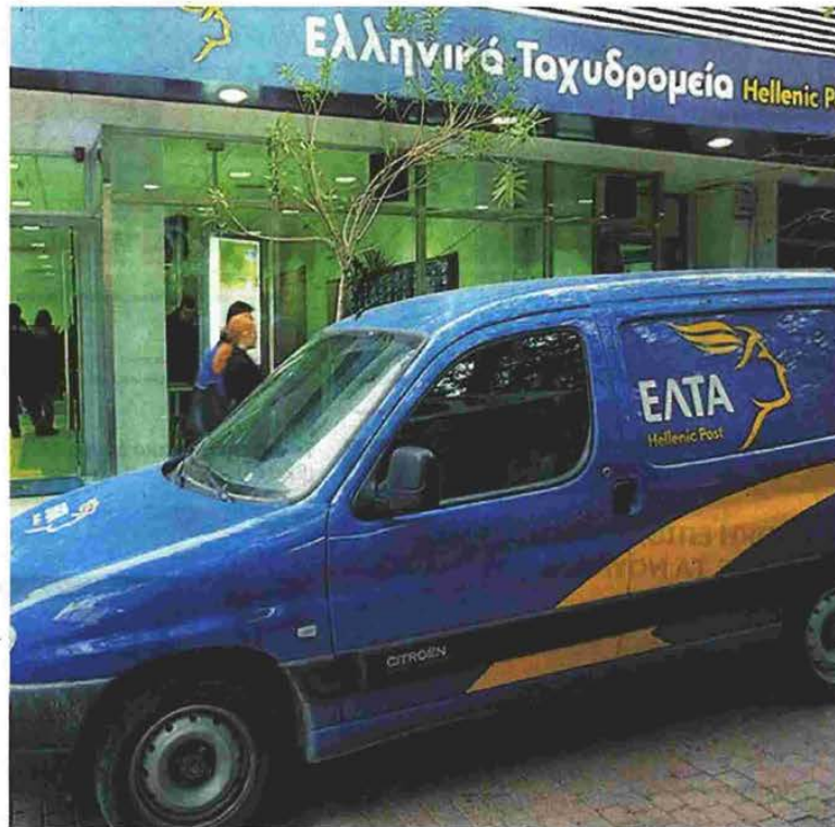
Μια κινηματογραφική ληστεία σε χρηματοπιστολή των ΕΛΤΑ οδήγησε στην πρωτοποριακή απόφαση του Αρείου Πάγου.

Οι αποζημιωτικές αποφάσεις της Δικαιοσύνης σε τέτοιες περιπτώσεις έχουν ιδιαίτερο ενδιαφέρον λόγω της πληθώρας παρόμοιων περιστατικών ανά τη χώρα, που ανοίγουν τον δρόμο για οικονομικές αξιώσεις όχι μόνο σε