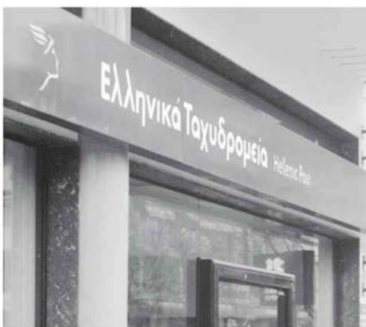
Τα ΕΛΤΑ , που αντιμετωπίζουν σοβαρά προβλήματα ρευστότητας, υπολόγιζαν να λάβουν 50 εκατ. ευρώ ετησίως για την καθολική υπηρεσία, δηλαδή 150 εκατ. ευρώ για την τριετία.

Μπορεί η σύμβαση να ρυθμίζει όλες τις λεπτομέρειες, βάσει των οποίων η καθολική υπηρεσία θα παρέχεται από τα ΕΛΤΑ για διάστημα έξι ετών, ορίζει όμως το