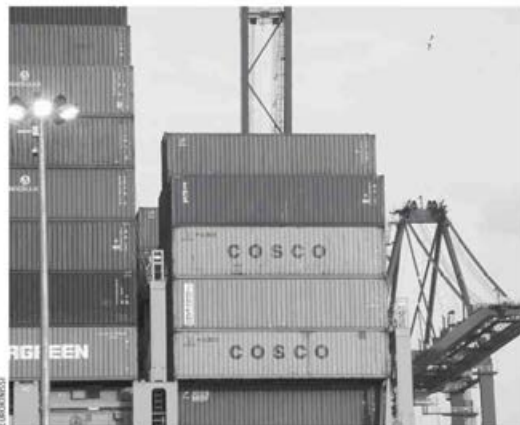
Το 54% των επιχειρήσεων διατυπώνει αρνητικές προβλέψεις για τις εγχώριες οικονομικές εξελίξεις.

Το 52% των ερωτηθέντων αναμένει σταθερότητα στις εγχώριες πωλήσεις των επιχειρήσεών τους, ενώ ένα σημαντικό ποσοστό, 30%, εκτιμά ότι αυτές θα αυξηθούν, με το 59% εξ αυτών να αποδίδει αυτή την εκτίμηση στην εξεύρεση νέων πελατών. Σε ό,τι