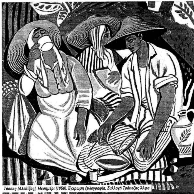
Τάσσοις (Αλεβίζος), Μεσημέρι (1958). Έγχρωμη ξυλογραφία, Συλλογή Τρόπεζας Άλφα

Μετά την απελευθέρωση, ο Τάσσοις άρχισε να ασχολείται και με άλλα θέματα πέρα από τα επικά του πολέμου, όπως γυμνά, νεκρές φύσεις και πορτρέτα, ενώ ταυτοχρόνως άρχισε να χρησιμοποιεί και χρώμα στις ξυλογραφίες